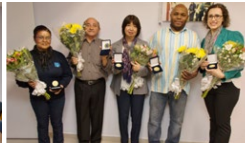
Os cinco colaboradores com mais “tempo de casa” da Sede.