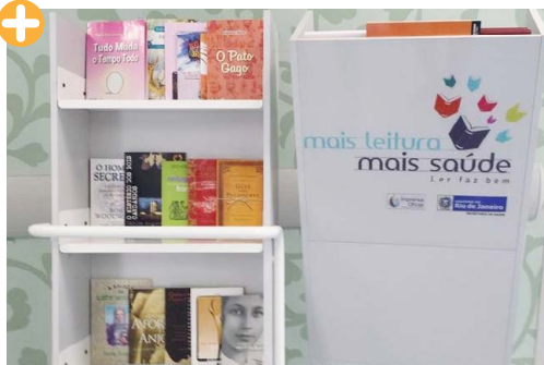
“Mais Leitura, Mais Saúde”

O Hospital Estadual Anchieta (HEAN) iniciou, em 17/07, o projeto “Mais Leitura, Mais Saúde”. A iniciativa vai disponibilizar, aos pacientes e acompanhantes, livros para serem utilizados durante a internação hospitalar, propondo um atendimento mais humanizado. O projeto, pioneiro no Rio de Janeiro, é fruto de uma parceria entre a Secretaria de Estado de Saúde (SES) e a Imprensa Oficial do Estado do Rio.