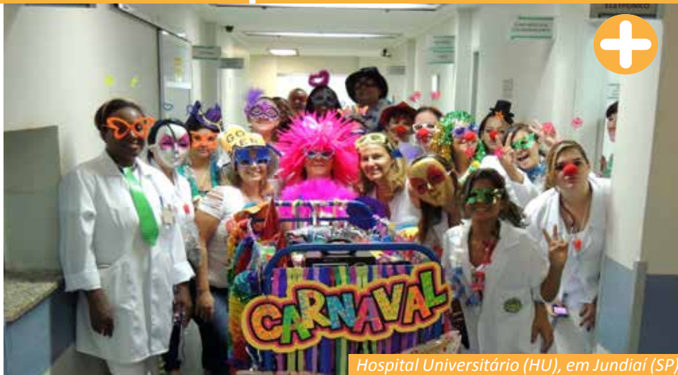
Hospital Universitário (HU), em Jundiaí (SP)