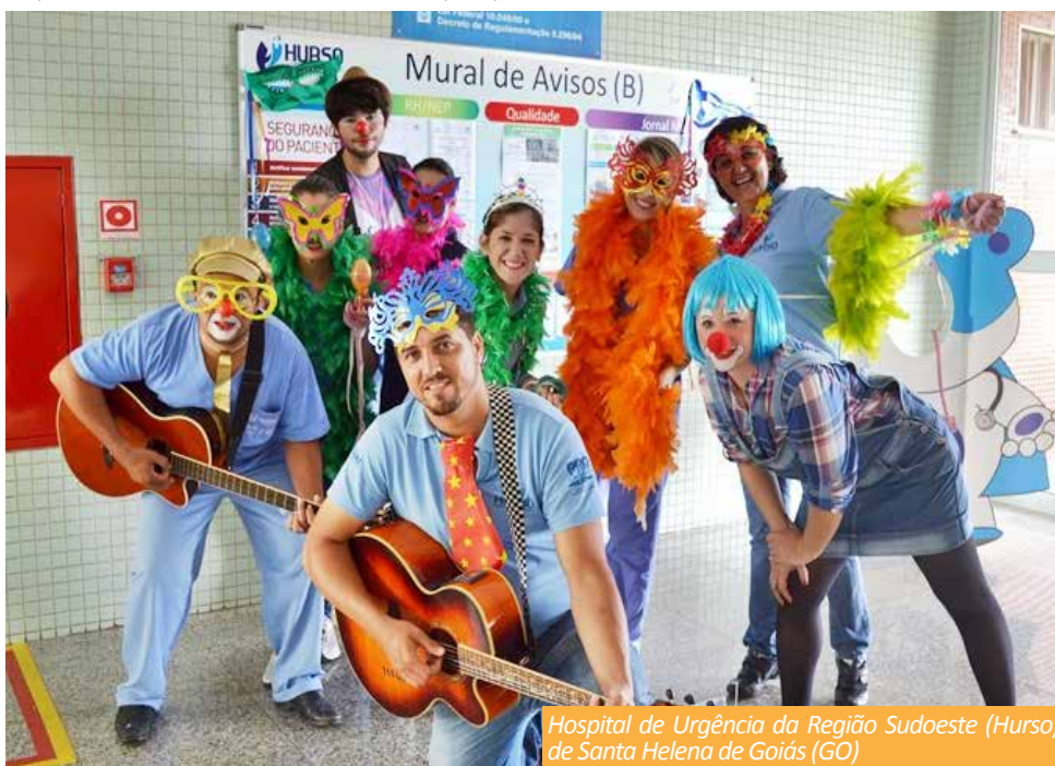
Hospital de Urgência da Região Sudoeste (Hurso), de Santa Helena de Goiás (GO)

Pará - “Samba no pé e higiene nas mãos!” Este foi o tema do grito de carnaval da Comissão de Controle de Infecção Hospitalar (CCIH) do Hospital Metropolitano de Urgência e Emergência (HMUE), em Ananindeua (PA). A iniciativa teve como foco conscientizar os profissionais de saúde a manter o padrão de higienização das mãos, essencial para a prevenção de infecção hospitalar. “Nossa primeira campanha do ano foi um grito de carnaval de conscientização, mobilizando todos os colaboradores a participarem do bloco de mãos limpas. Sabemos que essa medida simples é a mais eficaz para impedir a disseminação de